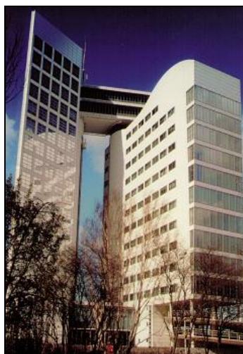
ICC och Eurojust i Haag

Ett projekt – Legal Tools – syftar till att samla all lagstiftning och alla domar av intresse i ett datasystem. Systemet skall vara tillgängligt via Internet för alla. Ett annat projekt – Case Matrix – syftar bland annat till att skapa manualer för förundersökningar och lagföring för att underlätta samordning med nationella utredningsenheter. Detta projekt bedrivs i samarbete bl.a. med universitet i Norge och Tyskland.